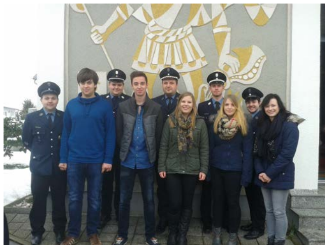
Bild Beitritt Hauptfeuerwehr zeigt